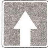
Дорога с односторонним движением