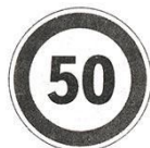
Ограничение минимальной скорости