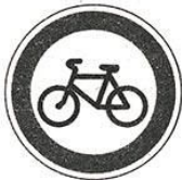
Движение на велосипедах запрещено