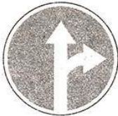
Движение прямо или направо