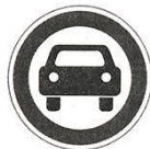
Движение механических транспортных средств запрещено