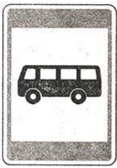
Место остановки автобуса и (или) троллейбуса