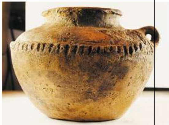
Керамика поздней бронзы Глиняная посуда Бегазы-Дандыбаевской культуры отличалась прямым горлышком и выпуклыми боками. Горшки украшались различными орнаментами. Часто встречаются игольчатый и волнистый узоры