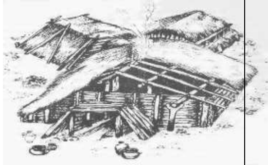
Жилище поздней бронзы