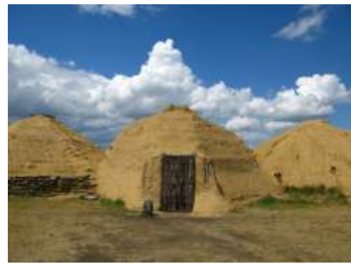
Полукруглое жилище андроновцев, землянка