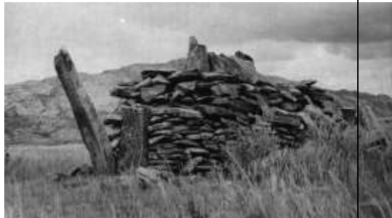
Курган поздней бронзы