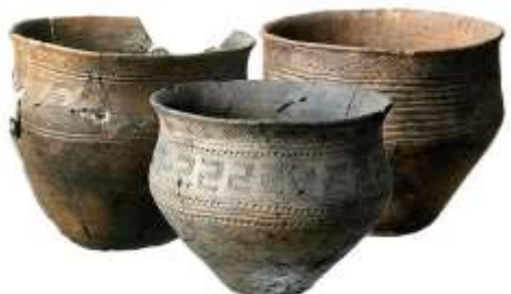
Керамические сосуды андроновской культуры (середина II тыс. до н.э.) Хранятся в ХНКМ